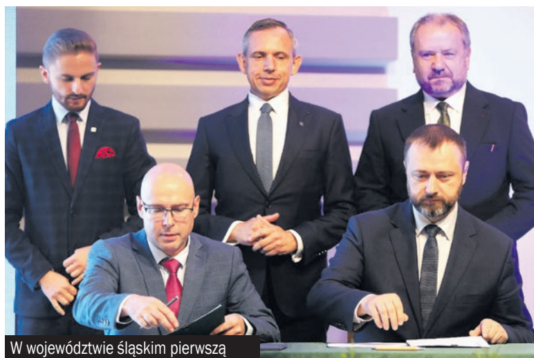
W województwie śląskim pierwszą gminą, która podpisała umowę w ramach programu „Ciepłe Mieszkanie” są Mysłowice. Mamy nadzieję, że tym śladem pójdzie też Jastrzębie-Zdrój.

Celem programu jest poprawa jakości powietrza oraz zmniejszenie emisji pyłów i gazów cieplarnianych poprzez wymianę tzw. „kopciuchów” i po-